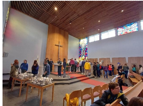
Beeindruckende Vernissage in der Kreuzkirche (Bild von Frau v. Blanckenburg)

Die Ausstellung ist noch bis zum 19. Juni in der Kreuzkirche am Wördemanns Weg zu sehen. Wir laden alle herzlich ein, die Werke vor Ort zu betrachten.