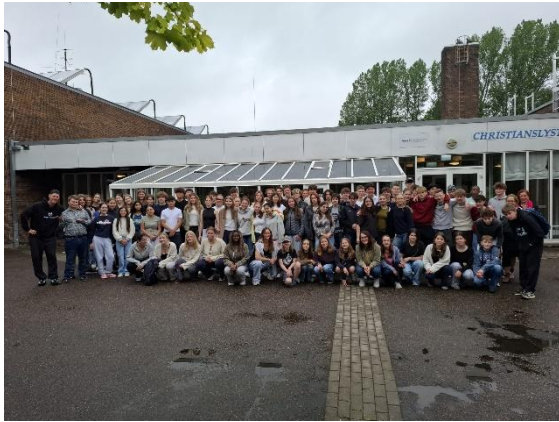
Gruppenbild vor der Jugendherberge

Beeindruckende Vernissage der Kunstkurse im Jahrgang 9 in der Kreuzkirche: Am Dienstag Vormittag durften wir in der Kreuzkirche Wördemanns Weg eine ganz besondere Vernissage feiern: Unter dem Titel „Natur in mir“ präsentierte der 9. Jahrgang seine beeindruckenden Skulpturen und Bilder.