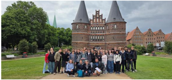
...und beim gemeinsamen Besuch in Lübeck