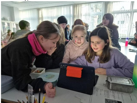
Viel Freude bei den kids beim dt-franz.Tag am Ath

In der zweiten Pause sorgte eine Pausendisko mit französischer Musik für ausgelassene Stimmung. Den stimmungsvollen Abschluss bildete eine Gesangseinlage des bekannten Liedes „Aux Champs-Élysées“, begleitet am Klavier. (Bericht von Frau Grey)