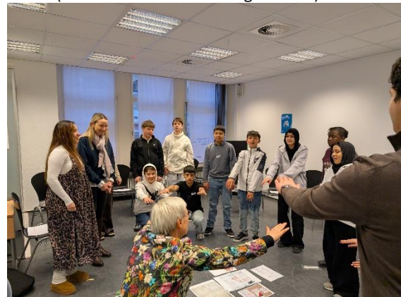
Viel Spaß hatten unsere IVK Schüler beim Demokratieworkshop

Demokratiebildung teilzunehmen. Dabei spielten unter anderem Hürdenläufe, Schattenspiele und Malaktionen eine große Rolle. Die Kinder durften Demokratie mit „allen Sinnen“ erleben und in den zahlreichen Diskussionen, Rollen- und Bewegungsspielen ein tiefes Verständnis für zentrale Begriffe unseres Grundgesetzes (Freiheit, Gleichheit, Meinungsfreiheit, Glaubensfreiheit, Versammlungsfreiheit, etc.) entwickeln. Am Ende des Workshops waren sich nicht nur alle einig, dass in Demokratie eine Menge Spaß stecken kann, sondern zugleich sehr froh, in einer Demokratie leben zu dürfen. Begleitet wurde der Ausflug von Frau Vilhelm, Frau Bugueño und Frau Heusinger-Kühn. (Bericht von Frau Heusinger-Kühn)