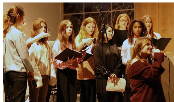
Pop Chor der Mittelstufe