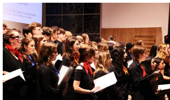
Festliche Stimmung anlässlich der ATh Weihnachtskonzerte in der Kreuzkirche: Unser Oberstufenchor