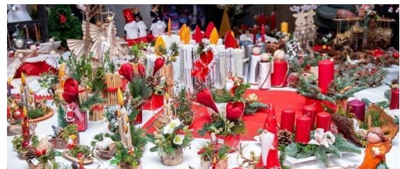
Alle Jahre wieder: ganz viel los beim ATH Weihnachtsbasar

Weihnachtsbasar: Einen wunderschönen, liebevoll organisierten Weihnachtsbasar duftete die ATH Schulgemeinschaft am Donnerstagnachmittag im neuen Schulhaus K erleben. Die Jahrgänge 5-7 hatten, unterstützt von vielen Eltern und den Klassenleitungen, ihre Stände bunt geschmückt und boten dabei allerlei Leckerer, Schönes und Selbstgebasteltes gegen eine kleine Spende an. Auch die Schülerteams beteiligten sich eifrig und so entstand eine wunderschöne vorfestliche Stimmung, die alle Teilnehmenden genossen haben. Die Erlöse der Stände gehen an Hilfsorganisationen, die Kinder in der Not unterstützen. Wenn fertig ausgezahlt ist, werden wir Ihnen / euch natürlich berichten, wieviel Geld wir sammeln konnten. Allen Beteiligten sei ganz besonders herzlich für die Vorbereitungen und allen Gästen ganz besonders herzlich für das Kommen und Spenden gedankt. Am Ende waren alle zwar etwas erschöpft, jedoch auch stolz und glücklich und konnten mit Fug und Recht sagen: das war ein ganz toller Weihnachtsbasar!!