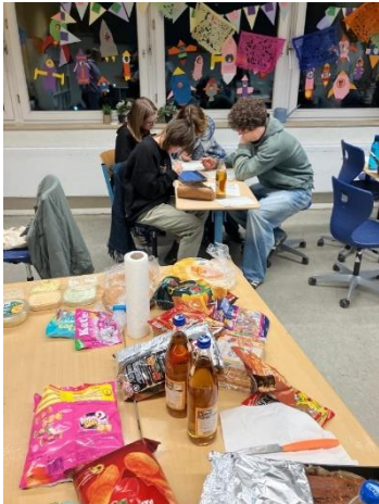
Tüftelnde Schülerin und Schülerinnen und Schüler des ATH im Rahmen der langen Nacht der Mathematik