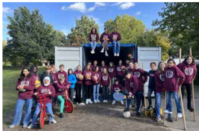
Das Team Bewegte Schule